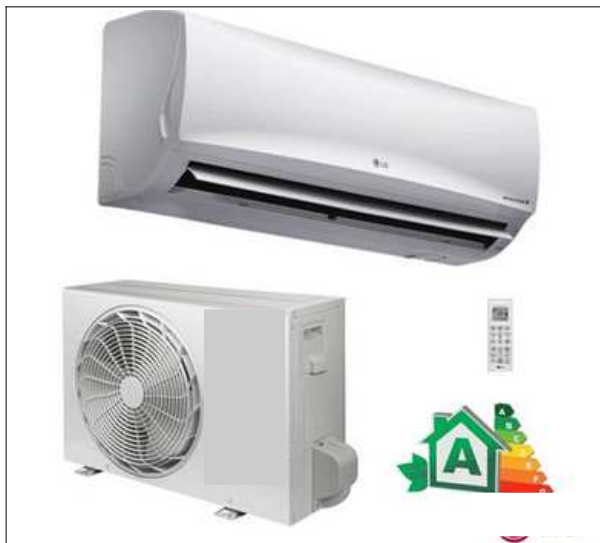
Figura 1. Climatizador Split high wall.