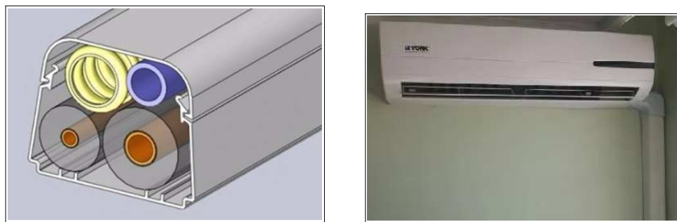
Figura 2. Modelo de canaleta de PVC e acessórios.

É importante atentar para não ocorrer esmagamento ou redução do isolamento térmico de forma a evitar a formação de condensado. Todas as emendas do isolamento devem ser feitas com cola especial, unidas por adesivo elastomérico com 3 mm de espessura. A tubulação frigorífica, dreno e cabos elétricos, nos locais internos e aparente devem ser todos suportados em canaletas de PVC conforme modelo ilustrado na Figura 2.